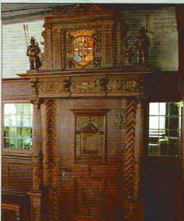
Tür zum Gerichts-Zimmer